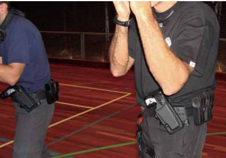
El Taser suele portarse en el lado débil a modo de "crossdraw" para evitar confusión con el arma de fuego.

El RA, en este punto concreto, regula el comercio interior de las defensas a las Fuerzas y Cuerpos de Seguridad, y prohíbe explícitamente la compraventa, tenencia y uso por particulares. Así pues, Andreu Soler i Associats puede importarlas y suministrarlas exclusivamente a Fuerzas y Cuerpos de Seguridad, al igual que las defensas y los tonfas, prohibiendo explícitamente su venta a particulares y seguridad privada –determinación coincidente con la Ley de Seguridad Privada–.